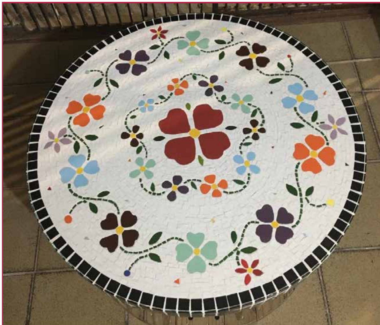
Remontando o Jardim no Mosaico: Pedacos da Natureza

AUTOR(A): Nadja Medeiros Justino da Silva