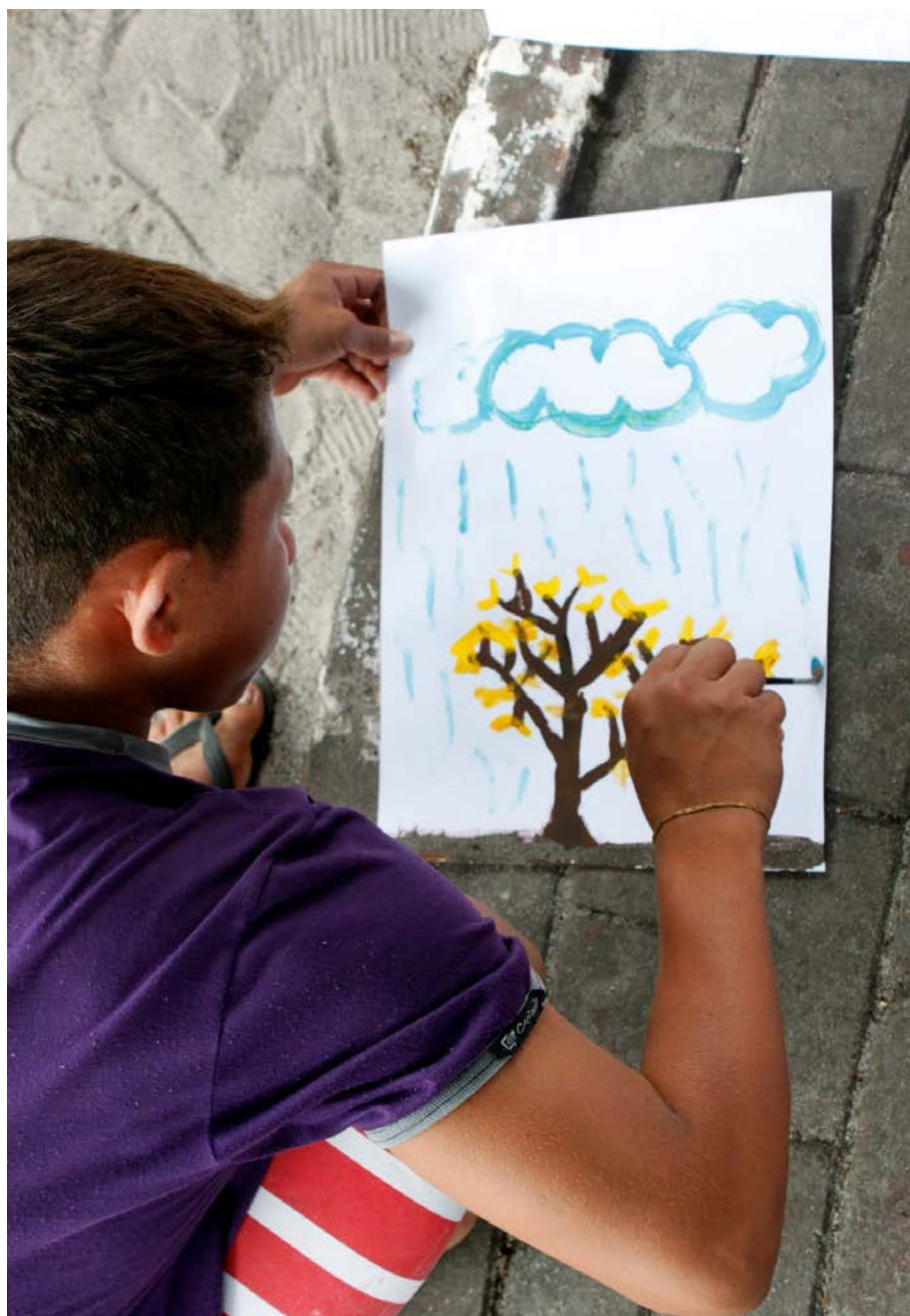
Infância para além das fronteiras

Fotografia colorida, em formato retrato, de um menino pardo, acorçado sobre um piso de concreto, rente à areia. Ele apoia um papel, sobre o piso, e desenha, com um pincel fino, uma árvore que recebe chuva de três nuvens. A base do desenho é da mesma cor do piso de concreto, dando a impressão que o desenho nasce dele.