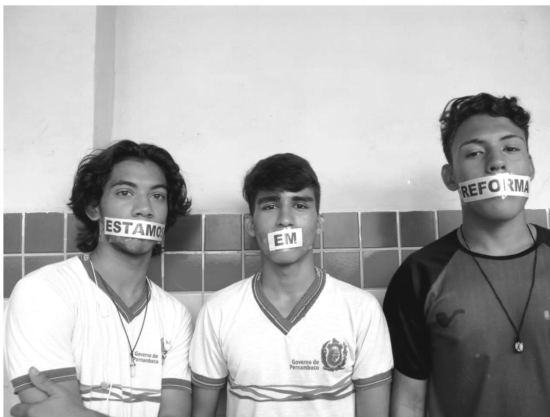
Sem Voz Sem Vez

Fotografia em preto e branco, em formato paisagem, do busto para cima de três meninos adolescentes em frente a uma parede. O da esquerda e o do meio usam uma camisa de uma escola da Rede Estadual de Ensino de Pernambuco e o da direita uma camisa preta. Todos olham para frente, com o semblante sério. Sobre a boca de cada um deles há um adesivo na cor branca, escrito em tinta preta, “estamos”, “em”, “reforma”.