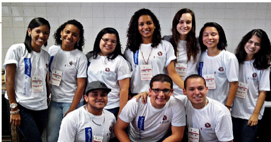
Alunos do curso de Engenharia de Alimentos - UFPE

III Semana de Engenharia de Alimentos - III SEA