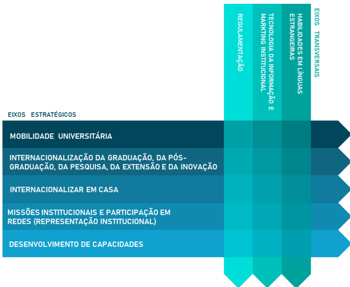
Figura 03 – Interseção entre eixos estratégicos e eixos transversais