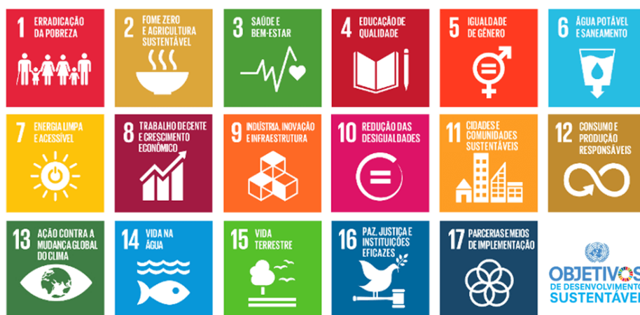
Figura 02 – 17 objetivos globais para o desenvolvimento sustentável. (Fonte: ONU, 2015).

Portanto, a internacionalização do ensino superior não deve ser vista como um fim em si mesma, mas como um vetor para mudanças e melhorias na formação e na produção do conhecimento que privilegia o constante diálogo entre o local e o global. Diversificar o corpo acadêmico e técnico e ampliar as possibilidades de trocas interculturais, acadêmicas e tecnológicas são importantes desafios dessa agenda.