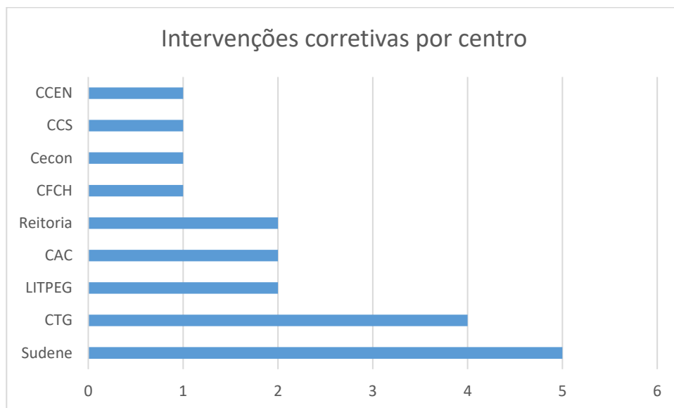
Figura 3- Distribuição das intervenções corretivas por centro da UFPE

Está representada no gráfico abaixo a distribuição, por centro da UFPE, do total de intervenções de manutenções corretivas registradas no período.