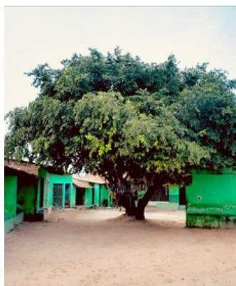
Ouricuri Indígena Fulni-ô - Retiro Sagrado